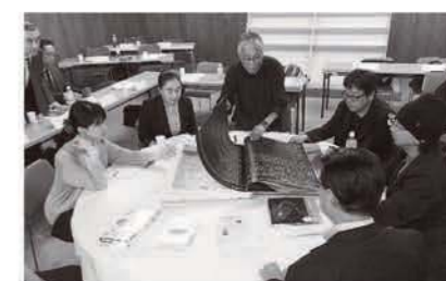
第52回審査風景: 第二次審査