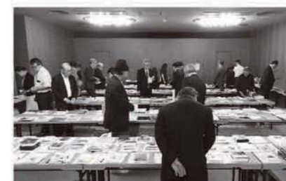
第52回審査風景: 第一次審査