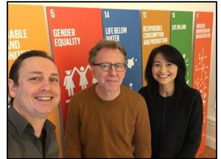
SDGs ロゴデザイナーらとグローバル・パートナーシップを推進

NPO One Planet Café ザンビア共同設立者、ワンプラネット・ペーパー協議会副会長、日本エシカル推進協議会発起人、東北大学大学院環境科学研究科非常勤講師(2005-2015)、株式会社イースクエア取締役(2002年-2015年。企業向けCSR・環境取り組み支援、研修、講演)、著書「うちエコ入門 温暖化をふせぐために私たちができること」(共著、宝島社)、「地球が教える奇跡の技術」(執筆協力、祥伝社)