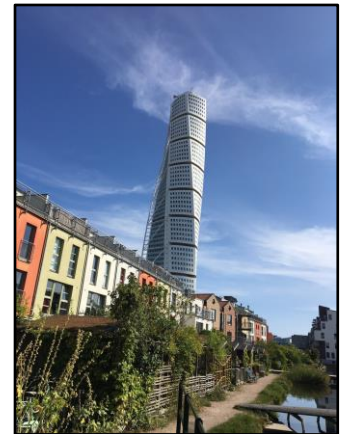
視察ツアーでは欧州初のカーボンニュートラル地域などを案内