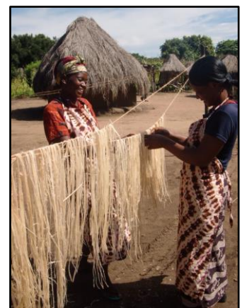
通常廃棄されるバナナの茎から繊維を取り出し、紙づくりを行う