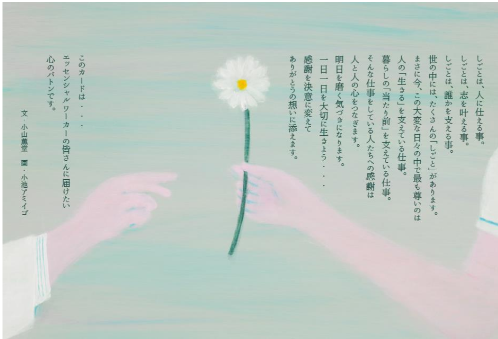
感謝のポストカード「心のバトン」