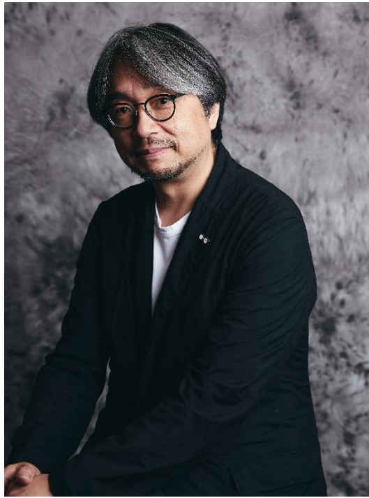
企画・文・朗読 小山薫堂氏