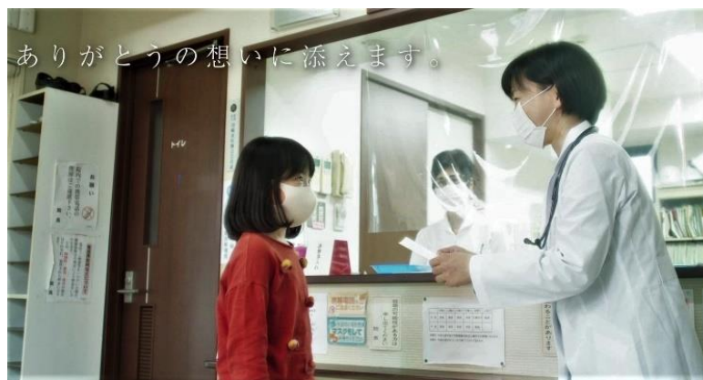
「感謝のポストカード『心のバトン』」プロモーションビデオより https://youtu.be/APCGDMDrADQ