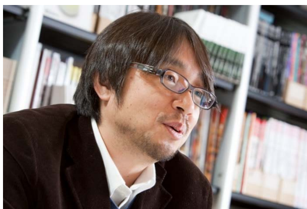
◎小山薫堂審査委員長

今回の「印刷と私」コンテストの開催にあたり、小山薫堂審査委員長から特別にメッセージをいただいております。