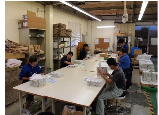
サポートセンター「あゆみ」での作業風景