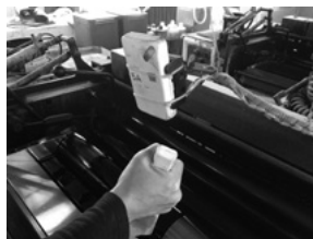
印刷機の上部に設置