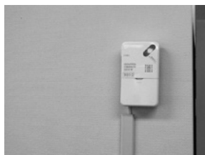
印刷機と印刷機との間の柱に設置