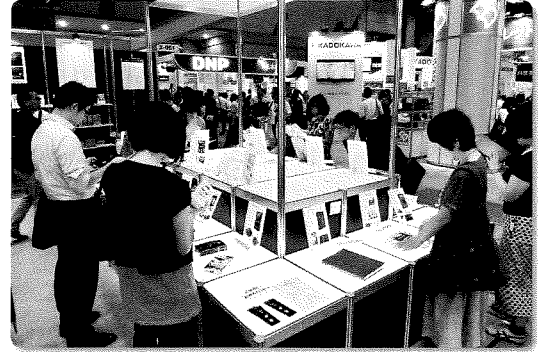
東京国際ブックフェア 公開展示