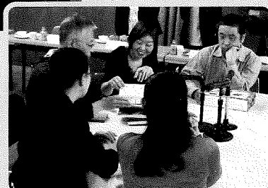
第49回審査会の様子