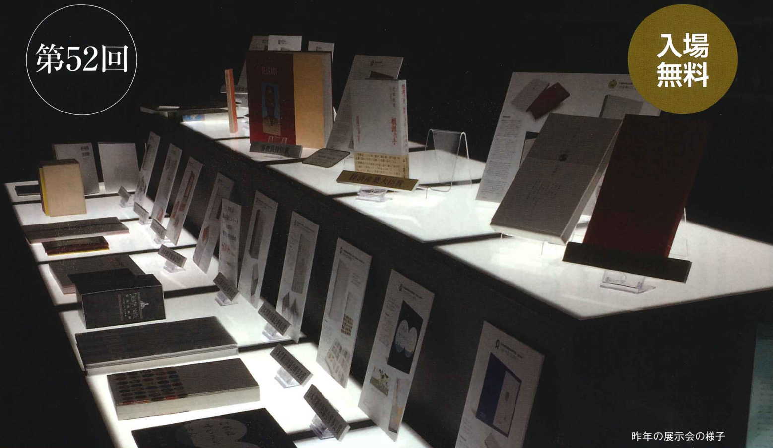
昨年の展示会の様子